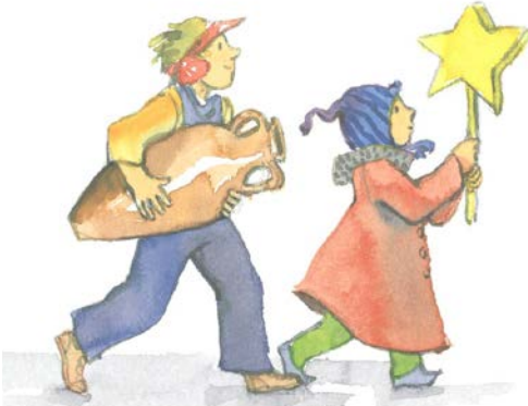
Illustration Brigitte Smith.

Aufführungen Mittwoch, 10. Dez., 14 Uhr (Gemeindenachmittag)