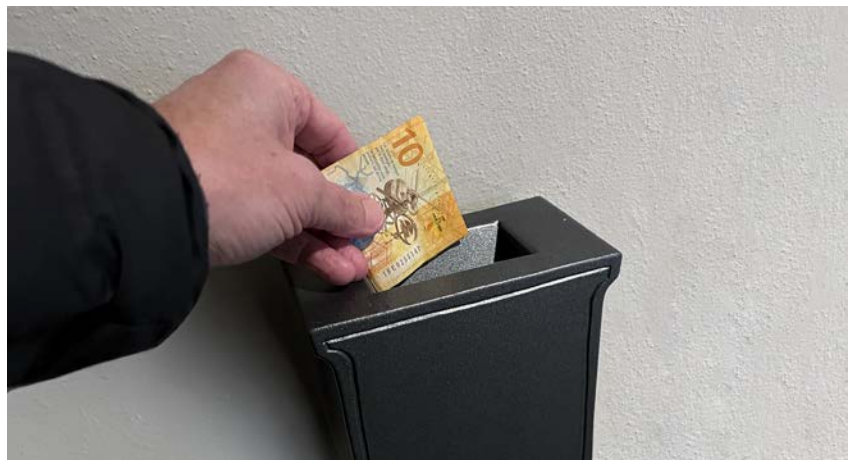
Jeder Beitrag zählt und hilft.