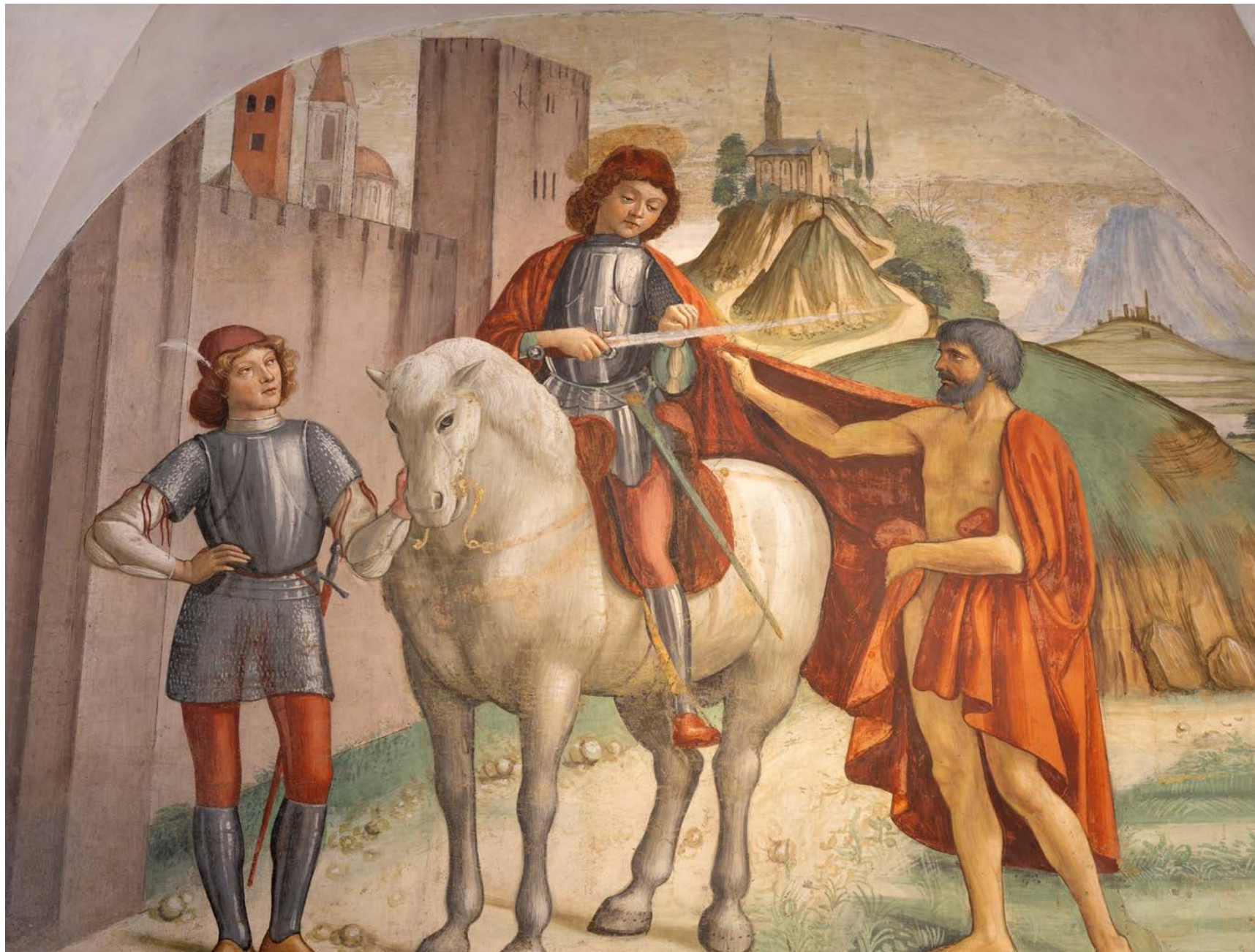
Das Renaissance-Fresko des Heiligen Martin in der Kirche Badia Fiorentina in Florenz.

Öffnungszeiten: Montag–Freitag, jeweils 8–12 Uhr