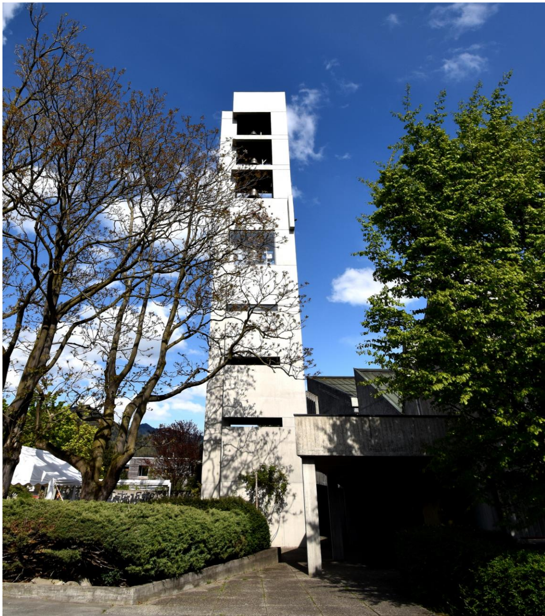
Kirche Johannes, April 2024, PBü

Donnerstag, 30. Mai 2024, 19.30 Uhr, Saal Johanneskirche